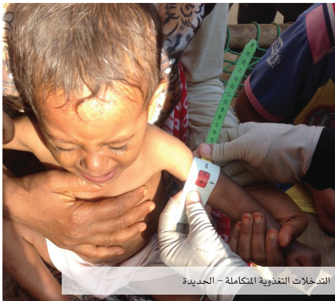
التدخلات التغذوية المتكاملة - الحديدة

وحتى الآن، فإن الأنشطة التي قام بتنفيذها الصندوق يمكن تلخيصها في فتح مكتب للبرنامج، واختيار وتعيين الموظفين لكل من المكتب الرئيسي وفرعي صنعاء وتعز، وإنشاء نظام إدارة المعلومات الخاص بالبرنامج. كما تلقى موظفو البرنامج دورات تدريب خارجية وداخلية، وجرى تنظيم زيارة لهم إلى تجربة مماثلة نفذها بنك الإعمار الألماني في محافظة لحج. وبالإضافة إلى ذلك، تم الانتهاء من وضع استراتيجيات وخطط العمل، كما نُفذت أنشطة تحضيرية ميدانية في المنطقتين اللتين يجري تجريب البرنامج فيهما، وهما مديريتا مناخة والشاميتين (في محافظتي صنعاء وتعز، على التوالي).