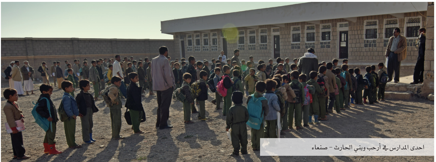
أحدى المدارس في أرحب وبني الحارث - صنعاء

تمت الموافقة خلال الربع على مشروع واحد بكلفة تقديرية تقارب 1.2 مليون دولار. وبذلك، يصل العدد التراكمي لمشاريع القطاع إلى 5,278 مشروعاً بكلفة تقديرية تبلغ حوالي 758.5 مليون دولار، بينما تجاوز العدد المتوقع للمستفيدين المباشرين 2.8 مليون شخص (46% منهم من الإناث)، وعدد فرص العمل المتولدة عن هذه المشاريع تقارب 25 مليون يوم عمل. ومن تلك المشاريع، تم إنجاز 4,598 مشروعاً بكلفة تتجاوز 548 مليون دولار. النقد مقابل خدمات اجتماعية في التعليم يهدف هذا البرنامج--الذي يتم تنفيذه لفترة 3 سنوات بدعم من منحة للبنك الدولي يصل إلى 10 ملايين دولار-- إلى خلق فرص عمل مؤقتة لحوالي 1,150 شاباً وشابة (من ذوي الأعمار بين 18-30 عاماً) من خلال تطوير وتعزيز مهاراتهم وكفاءاتهم للعمل كمعلمين وميسرين في مرحلة التعليم الأساسي وفي محو الأمية وتعليم الكبار، وكذا عبر المساهمة في تسهيل الوصول إلى خدمات التعليم في المجتمعات المستهدفة.. حيث سيتم إتاحة ما يقارب 750 ألف يوم عمل. وقد تم-- حتى الآن-- إجراء مزيد من التفتيح والتحسين لدليل العمليات الخاص بالبرنامج،