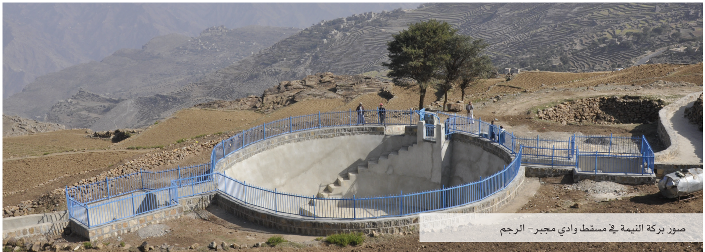
صور بركة النيمة في مسقط وادي مجبر - الرجم

وبهذا يكون إجمالي المشاريع المنجزة في هذا البرنامج 81 مشروعاً بكلفة إجمالية بلغت 9.4 مليون دولار لخدمة 81 ألف شخص. شملت المشاريع 24 خزاناً عاماً مسقوفاً لحصاد مياه الأمطار، و7,205 سقايات خاصة بسعة إجمالية 98,900 م 3 ، وكذلك 15 كرفياً بسعة إجمالية 53,400 م 3 ، و22 منهلاً عاماً، و5 خزانات، وشبكة توزيع بطول إجمالي يقارب 10,000 متر.