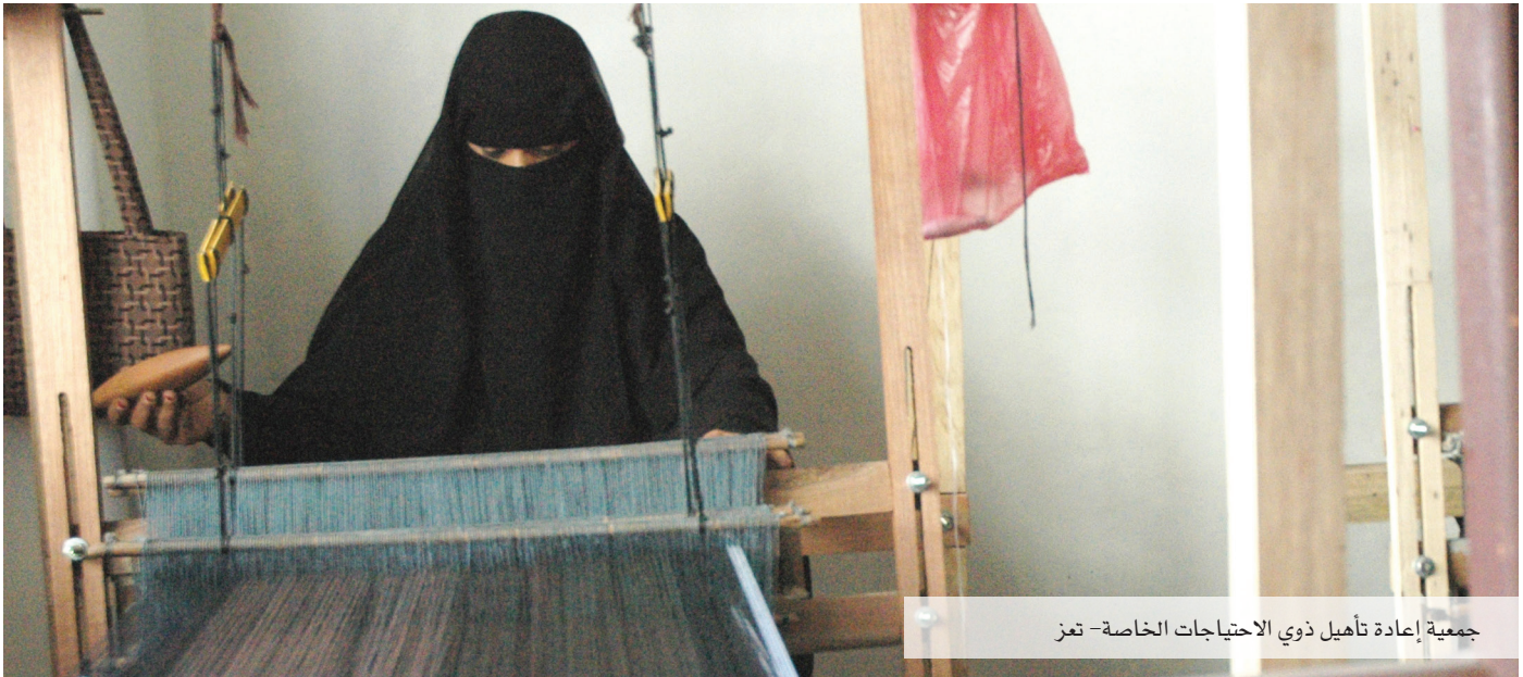
جمعية إعادة تأهيل ذوي الاحتياجات الخاصة - تعز