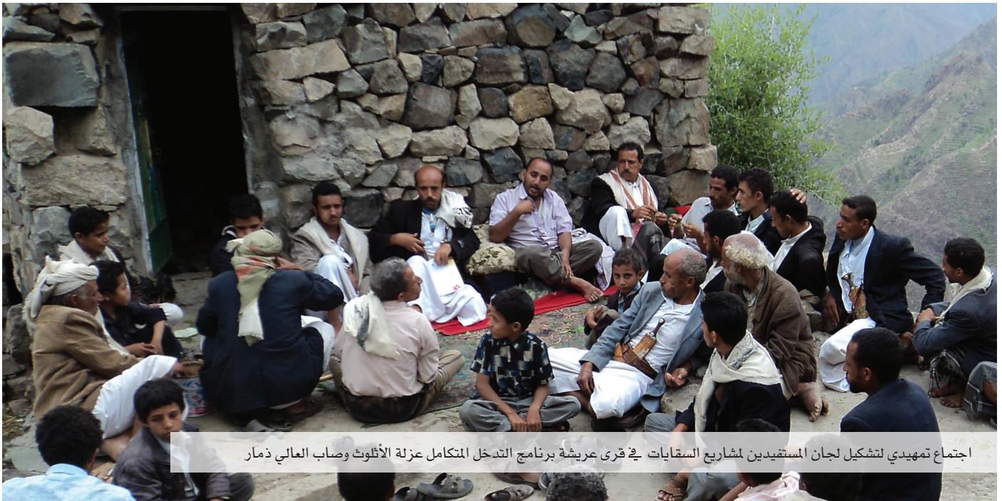
اجتماع تمهيدي لتشكيل لجان المستفيدين لمشاريع السقايات في قرية عريشة برنامج التدخل المتكامل عزلة الأثلوث وصاب العالي ذمار

بلغ العدد الإجمالي التراكمي لمشاريع البرنامج 325 بكلفة تقديرية تقارب 32.3 مليون دولار، يُتوقع أن يستفيد منها حوالي 324 ألف شخص (51% منهم من الإناث)، وتتولد عنها قرابة