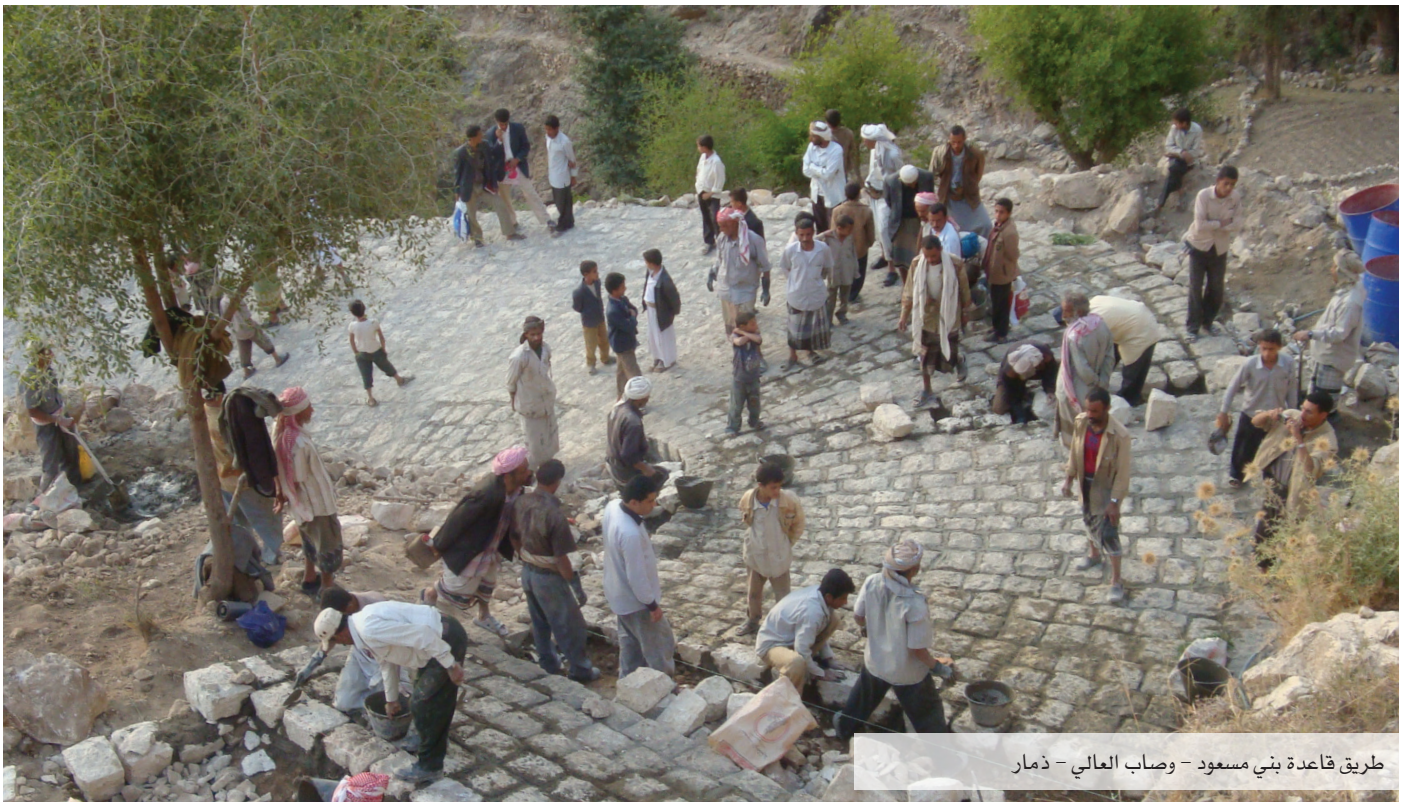
طريق قاعدة بني مسعود - وصاب العالي - ذمار

وصل الإنجاز التراكمي للقطاع إلى 846 مشروعاً بكلفة تقديرية تقارب 193.4 مليون دولار، يستفيد منها حوالي 4.4 مليون شخص (نصفهم تقريباً من الإناث)، وتتولد عنها حوالي 9.1 مليون فرصة عمل. ومن هذه المشاريع، تم إنجاز 679 مشروعاً بتكلفة تتجاوز 138.3 مليون دولار.