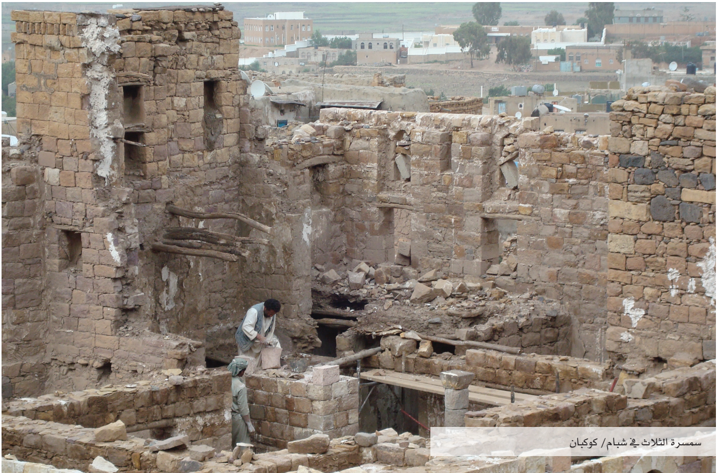
سمسرة الثلاث في شبام/ كوكبان